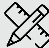
3 - Trena e lápis para marcação